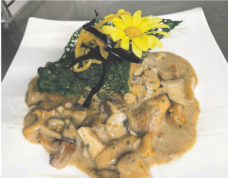
Neue Wildkreationen bereichern die Menükarte.